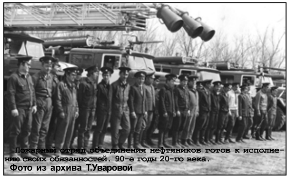
Пожарный отряд объединения нефтяников готов к исполнению своих обязанностей. 90-е годы 20-го века.