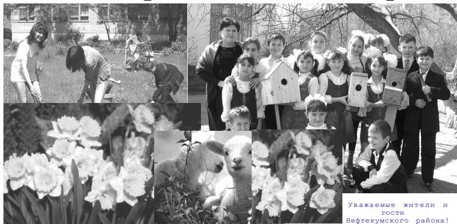
Уважаемые жители и гости Нефтекумского района!