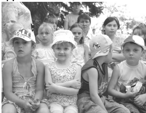
экологичи, что способствует их физическому и духовному развитию.

Согласно плану мероприятий по организации летнего труда, отдыха детей и подростков в Нефтекумском районе на 2007 год, утвержденному постановлением главы администрации Нефтекумского муниципального района Ставропольского края от 23 апреля 2007 года, в течение лета 2420 детей готовы принять лагеря и 525 человек – площадки по месту жительства. На территории нашего района дислоцированы 14 детских летних оздоровительных лагерей с дневным пребыванием и 5 площадок по месту жительства. Как показывает накопленный опыт работы, данный вид летнего отдыха детей наиболее приемлем и эффективен для нашего района. Лагерь и площадки, созданные на базе образовательного учреждения максимально приближены к месту проживания детей, доступны для свободного посещения, преподаватели и сверстники хорошо знакомы ребятам, что сводит период адаптации к нулю. Дети и подростки получают возможность индивидуального и реализовывать ее на практике, приобретают навыки организации летнего досуга и свободного времени своих друзей, приобретают опыт добровольного участия в делах по улучшению общественной жизни,