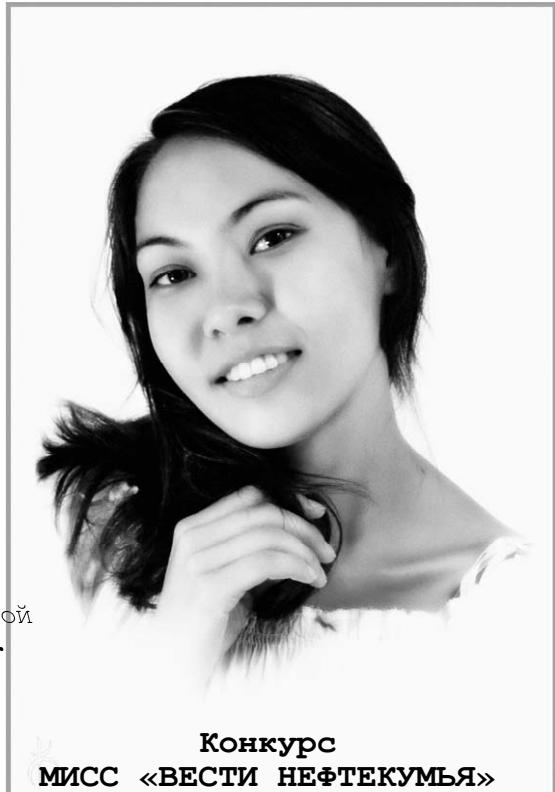
Конкурс МИСС «ВЕСТИ НЕФТЕКУМЬЯ»

Сегодня мы знакомим читателей с награжденными. Это своеобразная ГАЛЕРЕЯ ПОЧЕТА.