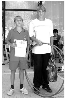
Тренирующая Нефтекумского муниципального района. Команда МОУ СОШ №10 примет участие в краевой спартакиаде пришкольных оздоровительных лагерей, которая состоится в Новоселинском районе на озере «Волчий Ворота».