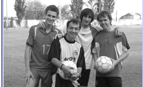
(Читайте материал на странице 4)