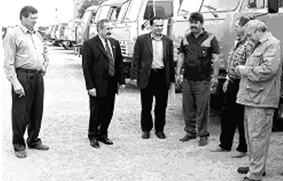
ОАО «Нефтекумскавтотранс» - одно из старейших предприятий района и края.

Более полувека коллектив транспортников претерпев различные организационные преобразования, выдержав негативный прессинг экономических реформ конца 20 го столетия, не поддавшись провокационным соблазнам банкротства и всеобщей приватизации, сохранил в основе себя, дал рабочие места не одному десятку нефтекумчан и сейчас стремится качественно и профессионально выполнять свое основное предназначение – осуществление перевозки грузов и пассажиров, а также транспортно-экспедиционное обслуживание населения. Так за 9 месяцев 2007 года предприятие оказало услуг по перевозке пассажиров объем который со-