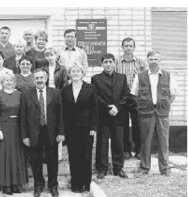
Здоровья вам, благоденствия, ровных дорог, попутного ветра, добрых встреч. Приятного чтения газеты «Вести Нефтекумья» в минуты отдыха.