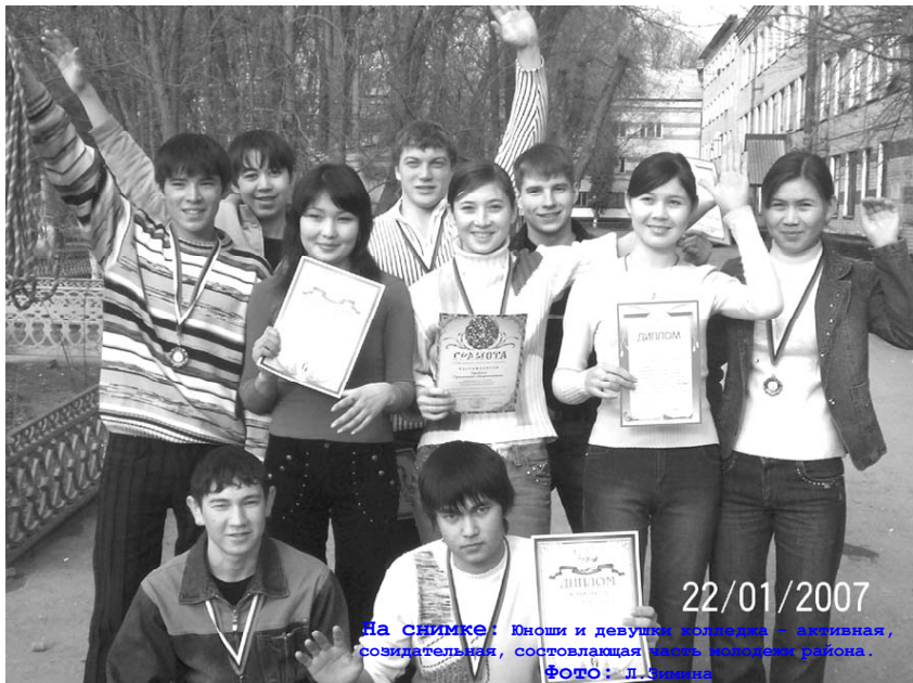
На снимке: Юноши и девушки колледжа – активная, инициативная, созидательная, составляющая часть молодежи района.

Региональный политехнический колледж сегодня – это творчески работающий коллектив, это 1515 студентов, это единственное государственное среднее профессиональное учебное заведение в Нефтекумском районе. Педагогический коллектив определяют опытные преподаватели и мастера производственного обучения. Среди Муратханов В.А. – заслуженный мастер РСФСР, Романова Л.Н. – отличник профессионально-технического образования РСФСР. Звание «Почетный работник на-