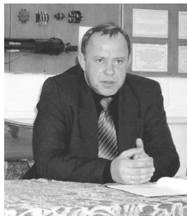
Спасибо вам за ваш самоотверженный и нелегкий труд.

Совет и администрация Нефтекумского муниципального района.