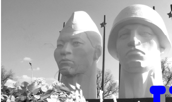
Газета распространяется в Нефтекумском и Левокумском районах