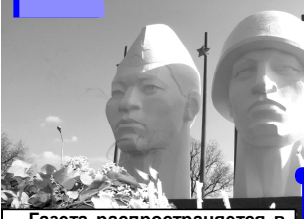
Газета распространяется в Нефтекумском и Левокумском районах