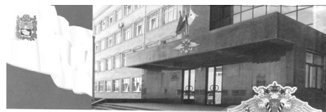
Управление Федеральной миграционной службы по Ставропольскому краю

Получателями государственной услуги по выдаче паспортов являются также граждане Российской Федерации, достигшие 14-летнего возраста и приобретение граждан-