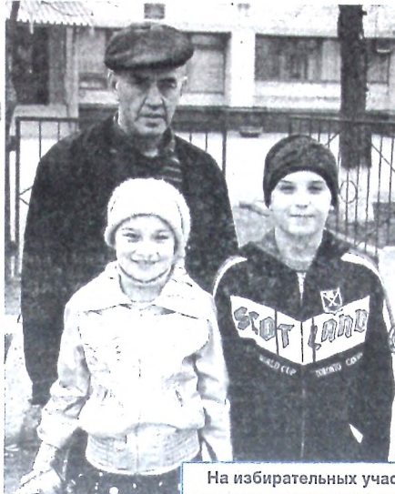
На избирательных участках города.