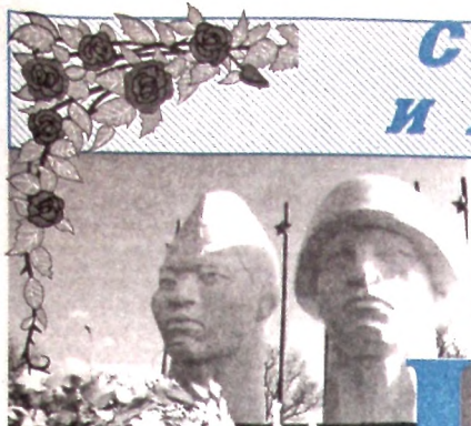
Газета распространяется в Нефтекумском и Лёвокумском районах

«Нефтекумская городская центрально-муниципальная библиотечная система» муниципалитетного образования «Городской библиотеки»