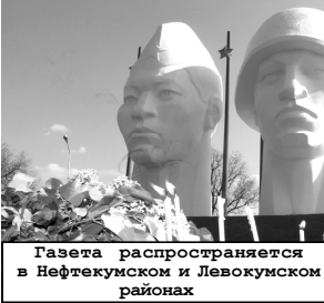
Газета распространяется в Нефтекумском и Левкоумском районах

Продолжается подписка на газету «Вести Нефтекумья» на второе полугодие 2008 года. Стоимость подписки прежняя – 72 рубля. Спешите подписаться и участвовать в лотерее!