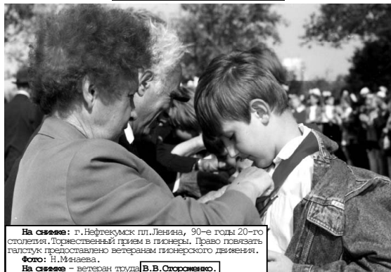
На сцене: г. Нефтекумск пл. Ленина, 90-е годы 20-го столетия. Торжественный прием в пионеры. Право повязать галстук предоставлено ветеранам пионерского движения.