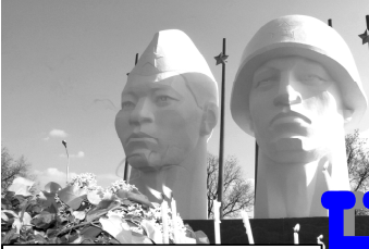
Газета распространяется в Нефтекумском и Левокумском районах

Остается месяц до завершения подписки на «Вести Нефтекумья». Стоимость на полугодие – 72 рубля. Всего лишь 12 рублей на месяц – и Вы в курсе всех новостей.