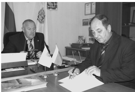
Село Уражайное – наш сосед по географии, по жизни и по судьбе. Он – первый на пути, когда мы коуту направляемся в столицу края – Ставрополь и проезжая говорим:

«Доброе утро, друзья – соседи! Прозимая с облегчением: «Ну, вот почти и дома», когда, возвращаясь домой, вьемзвем в это село».