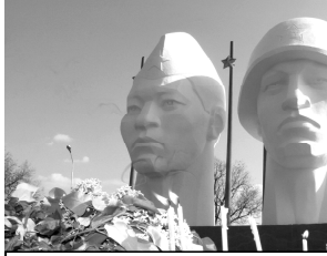
Газета распространяется в Нефтекумском и Левокумском районах

* Металлолом не воруют. Дело не возбуждать! * Что за стройка за окном? * Люди приходят и говорят власти...???!!!