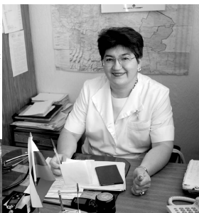
(БДВ), меры технической, медицинской, психологической, профессиональной и социальной реабилитации.

более 35 тысяч жителей этих районов. К нам обращаются люди за социальной помощью и защитой. При установлении группы инвалидности, им определяется пенсия, социальные льготы, ежемесячная денежная выплата