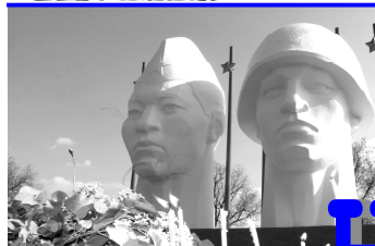
Газета распространяется в Нефтекумском и Левокумском районах

НАМОЛОЧЕНО БОЛЕЕ 120000 тонн хлеба Нефтекумья