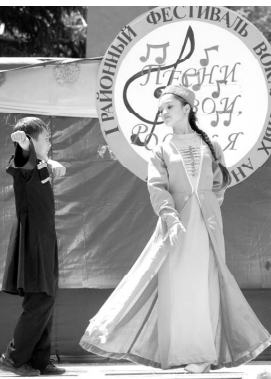
Все – в пляс

Народный ансамбль «Алтынай» из Каясулы давно известен не только в районе, но и в крае. Помните, как встречали его и во время проведения сельскохозяйственной выставки в городе Михайловске. Жители сел Ставрополья с интересом заходили в сооруженную ногайскую ярму. Знакомая с бытом, историей малочисленного народа, с удовольствием слушали их песни: заборные, напевные и немного грустные. Поэтому, когда здесь в Кара-Тюбе вышел ансамбль, не исполнивший ни одной песни, его встретили громом аплодисментов.