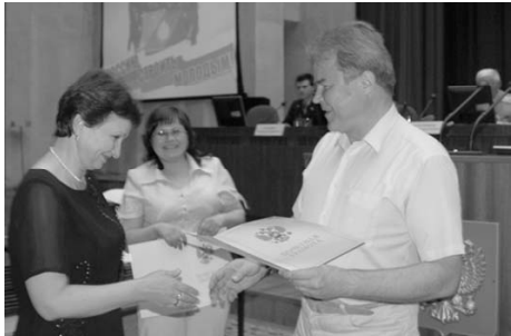
В. Балдицина, Вице-премьер ПСК вручает награды. см. стр. 2