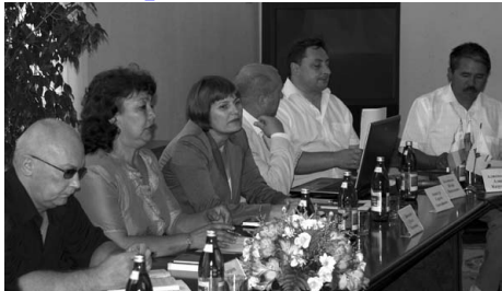
ООО «РН - Ставропольнефтегаз» впервые провел «Круглый стол» с муниципалитетами района.