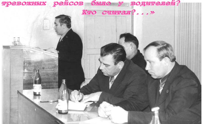
Продолжение темы стр. 5

Совет депутатов и администрация Нефтекумского муниципального района поздравляет с профессиональным праздником всех работников нефтяной и газовой промышленности, ветеранов нефтяников и газавиков и жителей города и района, кто так или иначе причастен к этой очень важной для страны отрасли!