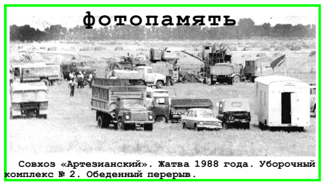
Совхоз «Артезианский». Жатва 1988 года. Уборочный комплекс № 2. Обеденный перерыв.