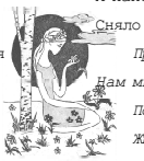
Природа явила уроч доброты, Нам милости знак обнаружит,