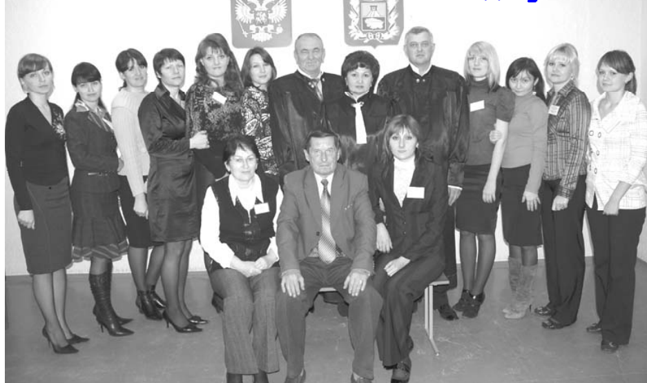
20 ноября 2008 года исполняется семь лет мировым судьям Нефтекумского района Ставропольского края. Читайте стр. 2