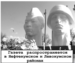
Газета распространяется в Нефтекумском и Левокумском районах

Спешите подписаться на любимую районку «Вести Нефтекумья» всего за 96 рублей на полугодие, и Вы будете в курсе новостей нашего и соседних районов.