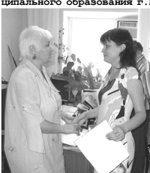
На учете в банке данных состоит 427 семей малоимущих, нуждающихся в улучшении жилищных условий.

На заседании были приглашены представители администрации ИМР, руководители городских учреждений и организаций, председатели ПСОС, представители города СМЖ.