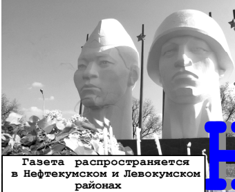
Газета распространяется в Нефтекумском и Левкокумском районах

Будьте внимательны! Африканская чума свиней рядом с нами! В Курском районе, в колхозе «Ростовановский», из-за чумы уничтожено 8 тысяч свиней, в том числе и в частном секторе.