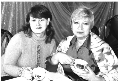
МЫ - НЕФТЕКУМЧАНКИ