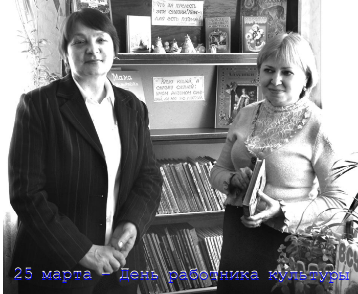
25 марта - День работника культуры