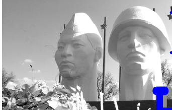
Газета распространяется в Нефтекумском и Левокумском районах

Продолжается подписка на газету «Вести Нефтекумья» на второе полугодие 2009 года по прежней цене - 96 рублей! Оставайтесь с нами!