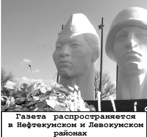
Газета распространяется в Нефтекумском и Левокумском районах

В. ГАВВИТСКИЙ, ГУБЕРНАТОР СТАВРОПОЛЬСКОГО КРАЯ. (ЧАСТЬ ДОКУМЕНТОВ ПРАВИТЕЛЬСТВА КРАЯ, ОПРЕДЕЛЯЮЩИХ РАЗВИТИЕ ВАЖНЕЙШЕЙ СФЕРЫ ЖИЗНИ КРАЯ НА ДОЛГОСРОЧНУЮ ПЕРСПЕКТИВУ ОПУБЛИКОВАНА В «СП» №66-67 ОТ 27 МАРТА 2009 Г. СТ. 4)