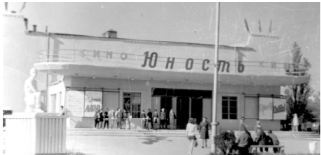
Так, в годы юности, нефтекумчане сегодняшнего дня проводили досуг в кинотеатре «Юность», теперь это магазин бытовой техники «Эльдorado», который, тоже прекратил свое существование. А что же будет завтра?