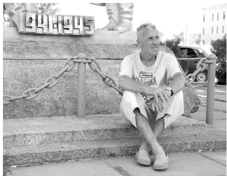
(Окончание. начало стр. 1)