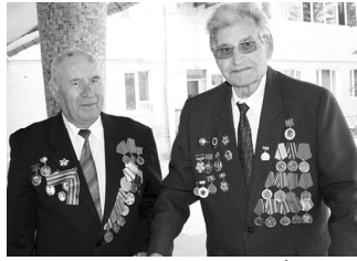
День за днем, в рабочих буднях рождаются ПОБЕДЫ, которые славят нефтекумьцев даже за пределами района. О некоторых из них - на страницах нашей газеты.