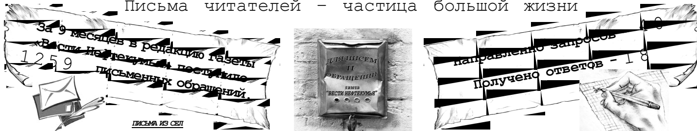
ПИСЬМА ИЗ СЕИ

Уважаемая редакция газеты «Вести Нефтекумья» прошу Вас опубликовать статью о добром человеке. Ведь газета «Вести Нефтекумья» очень популярна и читаемая газета.