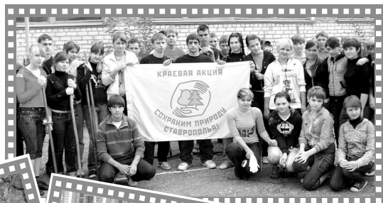
(на снимках с. Ачикулак).

Всего в тот день, молодежь района убрала мусор с территории площадью 11 гектар.