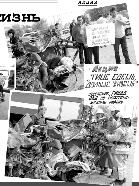
Собинфо. Фото Е.Новиковой.

Подписка на газету «ВН» принимается во всех почтовых отделениях Нефтекумского и Левокумского районов, стоимость –120 рублей за полугодие.