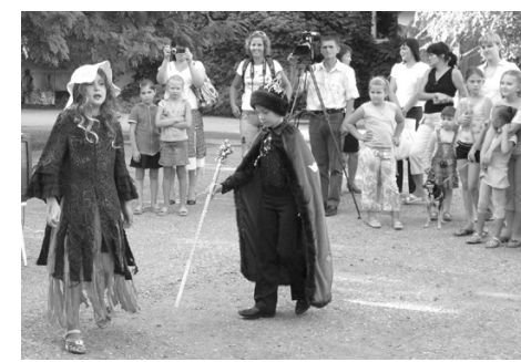
Текст и фото Р. Салиевой