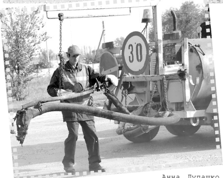
Член Союза журналистов России. На снимке: рабочие будни дорожников.