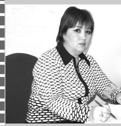
Главный бухгалтер Айчмен