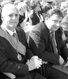
Иванович Киселев в со-... кумья на праздновании Дня