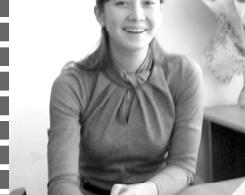
Оператор верстки газетных...