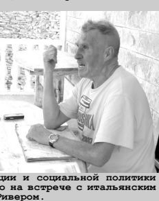
и социальной политики о на встрече с итальянскими «Ивигр», гармонь любима»