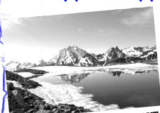
«Гора - это небо, покрытое камнем и снегом!» Слова Юрия Визбора.