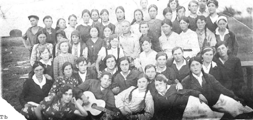
«Воспитан тракторных курсов по сельхозмашинистам. 10-9-1941 года по имени».

Если, кто-то узнал себя на фотографии, напишите о себе к нам в редакцию «ВН».