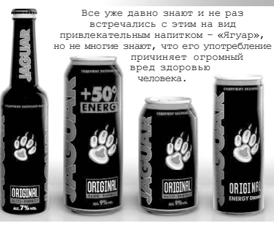
Все уже давно знают и не раз встречались с этим на вид привлекательным напитком - «Ягуар», но не многие знают, что его употребление причиняет огромный вред здоровью человека.

не законодательства в связи с употреблением алкоголя, предусмотренных следующими статьями: 6.1 «Увеличение несовершеннолетнему в употреблении пива и напитков, изготавливаемых на его основе, спиртных напитков или одурманивающих веществ»; 20.20 «Распитие пива и напитков, изготавливаемых на его основе, алкогольной и спиртосодержащей продукции либо потребление наркотических средств или психотропных веществ в общественных местах»; 20.21 «Появление в общественных местах в состоянии опьянения»; 20.22 «Появление в состоянии опьянения несовершеннолетних (в возрасте до 16 лет), а равно распитие ими пива и напитков, изготавливаемых на его основе, алкогольной и спиртосодержащей продукции, потребление ими наркотических средств или психотропных веществ в общественных местах».