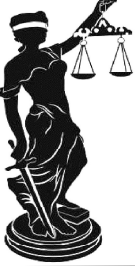
Текстическая полоса №2 (16)