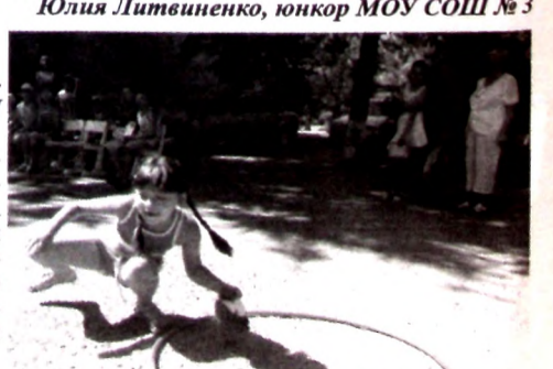
Фрагменты летнего отдыха.