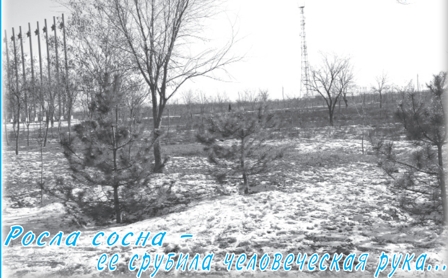
Росла сосна - ее срубил человеческая рука...