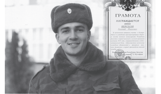
Здравствуйте, уважаемый глава администрации г.Нефтекумья! Обращается к вам военный комиссар республики Дагестан Дайтбег Магомедович Мустафаев.

Из редакционной почты БЛАГОДАРИМ ЗА СЛУЖБУ