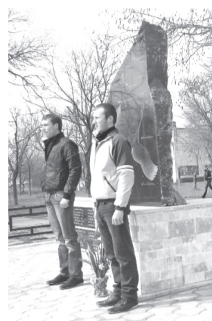
Фото и текст Р.Салиевой