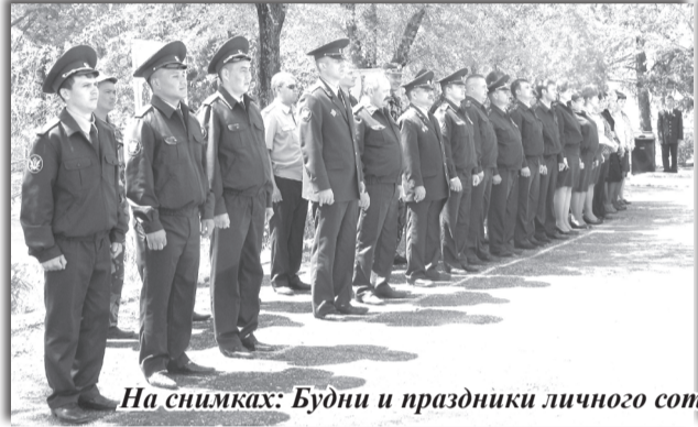
На снимках: Будни и праздники личного состава ЛИУ-8.