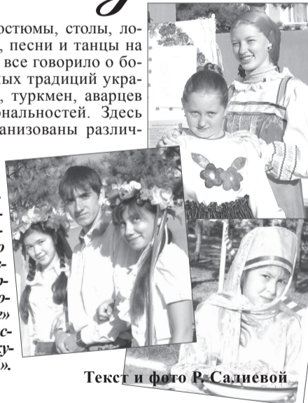
Текст и фото Р.Садиевой

Каждое муниципальное образование, которых в Нефтекумском районе двенадцать, приняло участие в выставке народного творчества «Национальное подворье» и фестивале «Расцветай, Нефтекумье, талантами!».