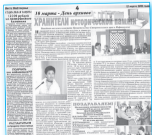
В Нефтекумске прошло выездное заседание коллегии комитета Ставропольского края по делам архивов с участием представителей органов власти муниципальных районов востока Ставрополья, муниципалитетов нашего района.