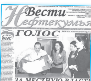
13 марта 2011 года в восьми муниципальных образованиях Нефтекумского района прошли выборы в органы законодательной и исполнительной власти...