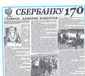
Сбербанку было 170