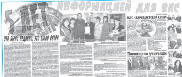
В конце ноября еженедельная газета Нефтекумского муниципального района «Вести Нефтекумья» отметила свое пятилетие.