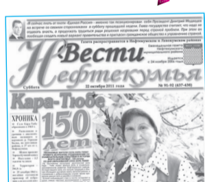
Свой юбилей отметило одно из старейших сел Нефтекумья - Кара-Тюбе.