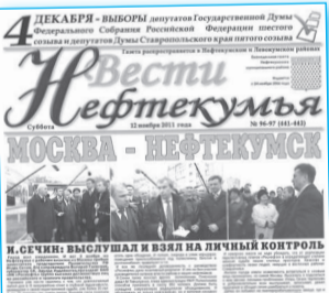
В первых числах ноября на Нефтекумье побывал с рабочей визитом председатель Правительства РФ Игорь Сечин.