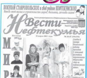
25 марта прошел 5-й юбилейный зональный фестиваль национального искусства «Мир на Нефтекумской земле»