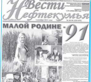
В этом году малой родине - Нефтекумью было 91.