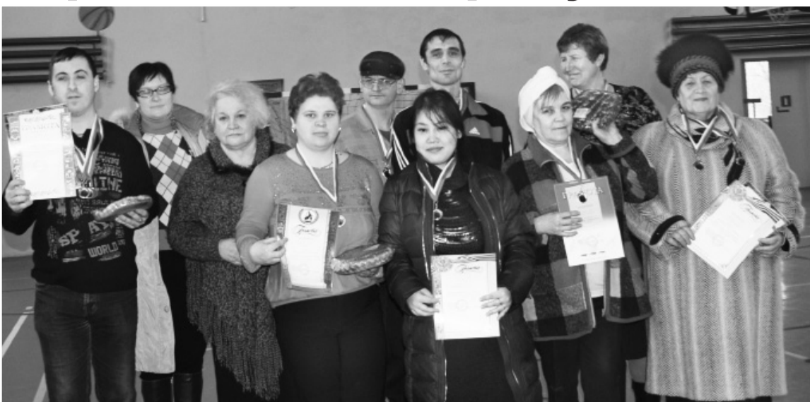
Седьмого марта стартовали Паралимпийские игры в Сочи.