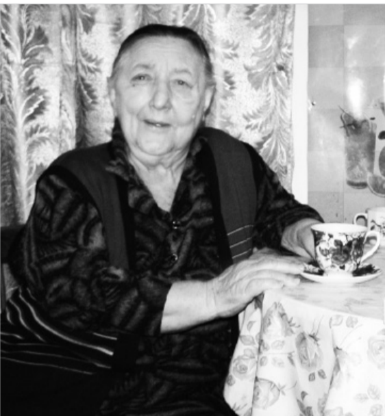
Есть в судьбе отрасли культуры села Ачикулак люди, о которых не сказать невозможно.

Вся их жизнь – это беззаветное служение культуре, ведь именно она всегда была и остаётся подвижничеством, уделом безгранично увлечённых. Речь пойдёт о тех, для кого творчество в любом его проявлении и есть жизнь. И пусть сегодня они уже не работают в учреждениях культуры, но от этого их вклад в творческую, общественную жизнь села и района, в эстетическое, патриотическое