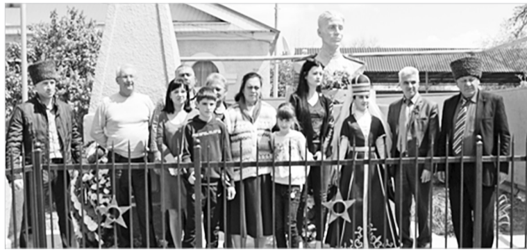
В ауле Новкус-Артезиан рядом с Братской могилой высится обелиск Героя Советского Союза Айдамира Ачмизова.

Родом он из аула Большой Кичмай Лазаревского района Краснодарского края. 2 декабря 1942 года Айдамир Ачмизов шесть часов сдерживал танки противника, расстрелял два тяжелых и три средних танка. Прямым попаданием вражеского снаряда Айдамир был убит. Указом Президиума Верховного Совета СССР от 31 марта 1943 года Ачмизову посмертно присвоено звание Героя Советского Союза.