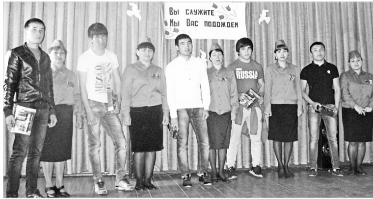
Надев военную форму, вчерашние мальчики станут защитниками Отечества, и от них будет зависеть мир и покой в нашей стране.

По традиции 28 апреля в ДК с. Озек-Суат состоялись торжественные проводы призывников в ряды Российской армии «Вы служите, мы вас пождем», посвященные 70-летию Великой Победы.