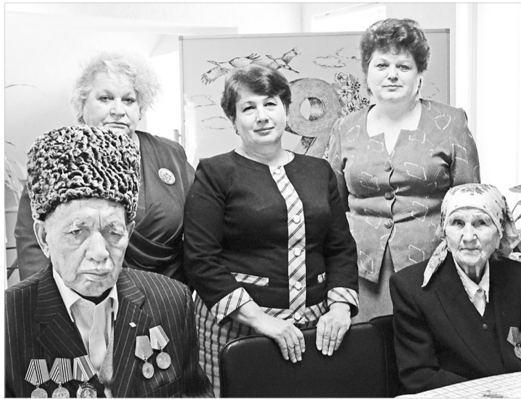
В Управлении ПФР по Нефтекумскому району в канун Дня Победы состоялось чествование ветеранов войны и тружеников тыла.