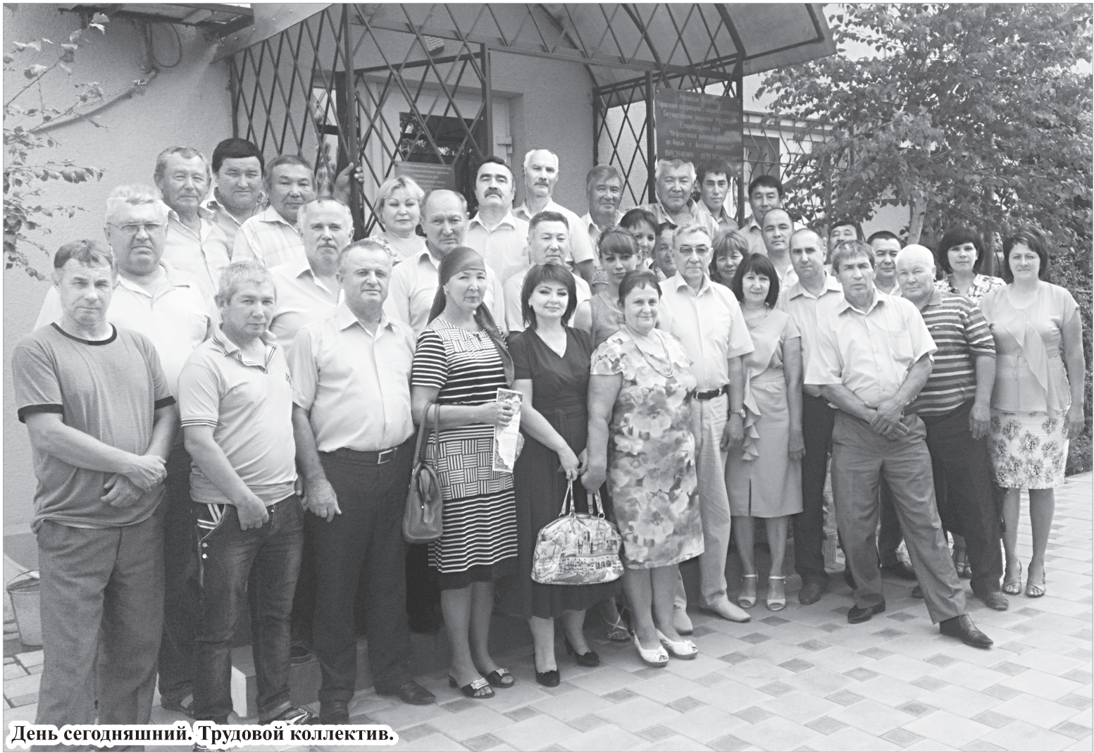
День сегодняшний. Трудовой коллектив.

повлечь массовое заболевание людей. К примеру, в начале года в ауле Бейсей был выявлен очаг по бруцеллезу среди крупного рогатого скота в частных подворьях. Владельцев заболевших животных обязали вывезти заражённое мясо на Георгиевский мясоперерабатывающий комбинат. Но, несмотря на усилия ветеринарных врачей, не всегда такое происходит. Многие владельцы не желают сдавать мясо на режимные мясоперерабатывающие предприятия, так как цены, предлагаемые там, намного ниже рыночных. Поэтому и пытаются они сбывать мясо туда, где платят больше, и, соответственно, не так строго контролируется качество мяса животных, не требуются обязательные в таких случаях документы, выдаваемые именно ветврачами.