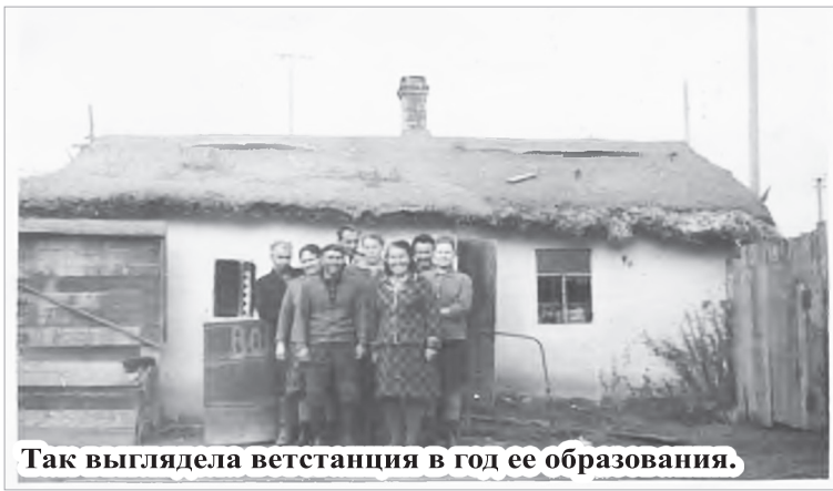
Так выглядела ветстанция в год ее образования.