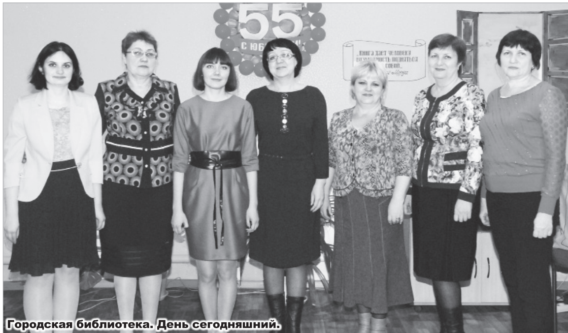
Городская библиотека. День сегодняшний.

А началась история этой святой обители литературы 27 октября 1960 года с клуба строителей, в котором проводили свой досуг молодые работники и даже играли свадьбы.