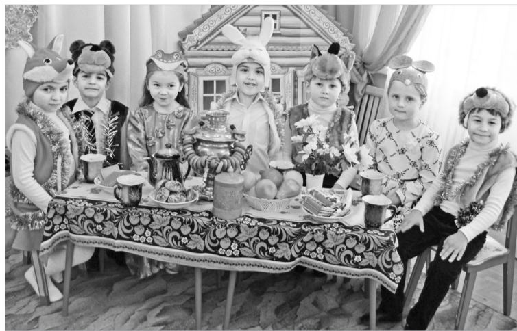
«Сказка – ложь, да в ней намек, добрым молодцам – урок!» – это выражение знакомо каждому из нас с детства.

Любая сказка, даже самая простая, несёт в себе определенный опыт поколений, мудрость предков, глубокий смысл и развивающий потенциал. Сказка не только помогает ребенку взглянуть на поступки сказочных героев со стороны, сделать оценки и выводы, а что самое главное, реализовать их в повседневной жизни.