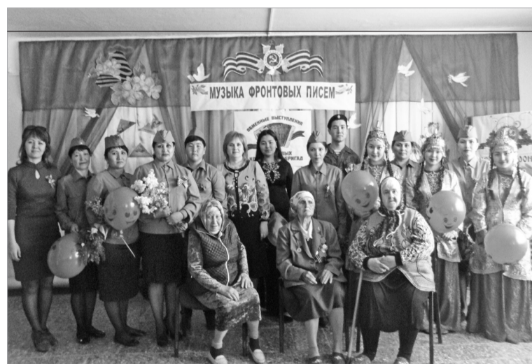
24 апреля в фойе школы посёлка Зимняя Ставка состоялось выступление фронтной концертной бригады Дома культуры села Озек-Суат посвящённое Дню Великой Победы «Одна у нас победная весна».

Согоньком и любовью, уважением к людям пожилого возраста, в память павших героев были исполнены фольклорный ансамблем «Бирлик» песни Великой Отечественной войны и послевоенных лет.