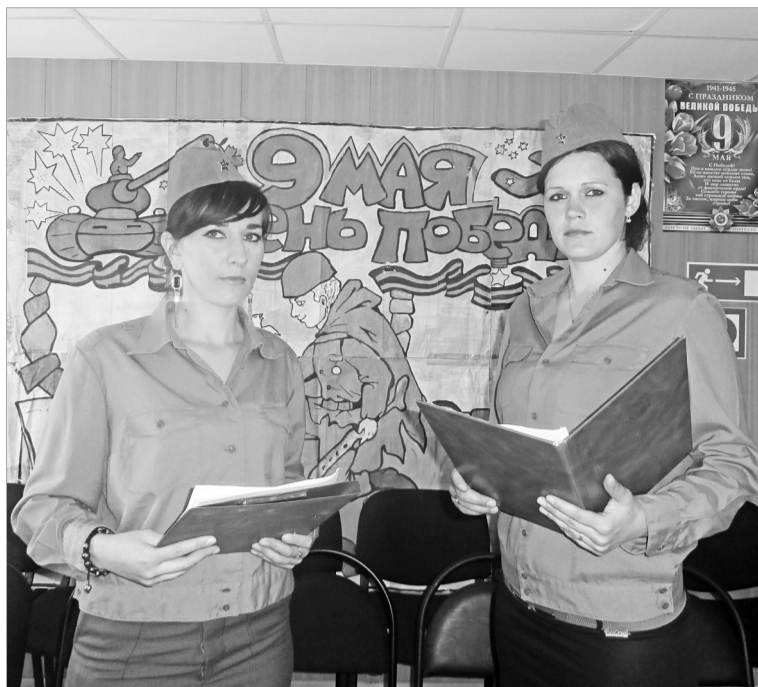
За годы Великой Отечественной войны не было ни одной воинской части, где бы ни побывали с выступлениями фронтные театры и бригады.

Вместе с Красной Армией артисты прошли весь путь войны. К их работе предъявлялись требования в духе военного времени: мобильность, готовность и способность выступать в непосредственной близости к передовой, играть везде – на палубах военных кораблей, под открытым небом, на аэродромах, в землянках, в блиндажах, на вокзалах, в агитпунктах, в медсанбатах, на лесных полянах, в оврагах.