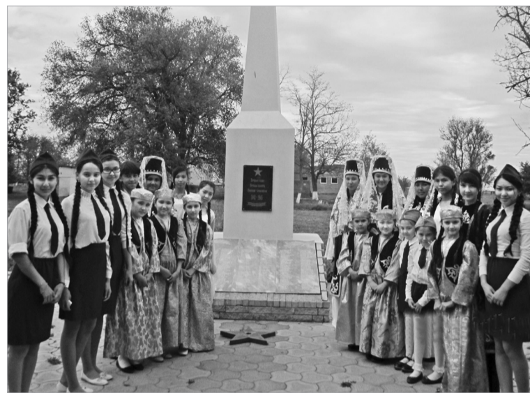
Концертно-фронтная агитбригада «Память» аула Махмуд-Мектеб побывала в ауле Тукуй-Мектеб с программой «Память жива», посвященной 71-ой годовщине Великой Победы.