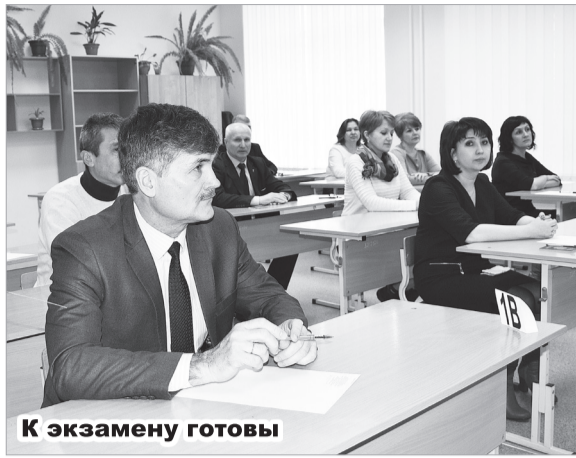
К экзамену готовы