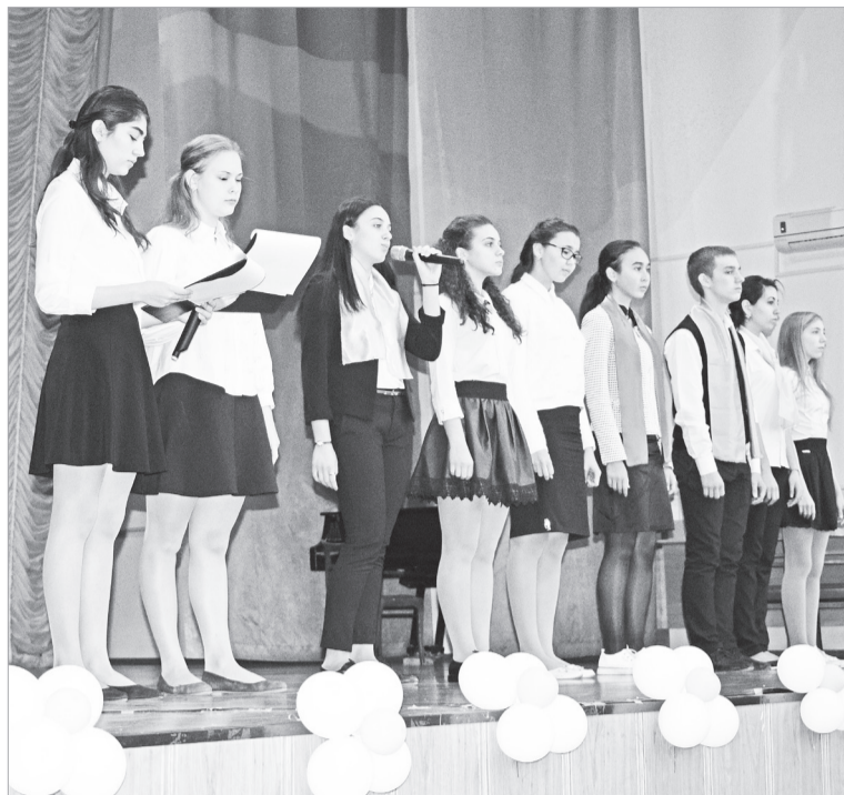
Накануне школьных каникул 3 февраля в Центре внешкольной работы состоялся слет патриотов районной детской общественной организации СДО «Дети Нефтекумья», посвященный Дню юного героя-антифашиста.

В зале собрались неравнодушные к жизни и делам нашей страны, ответственные за судьбу нашей малой родины, увлеченные детским движением лидеры из 18 общеобразовательных учреждений Нефтекумского района.