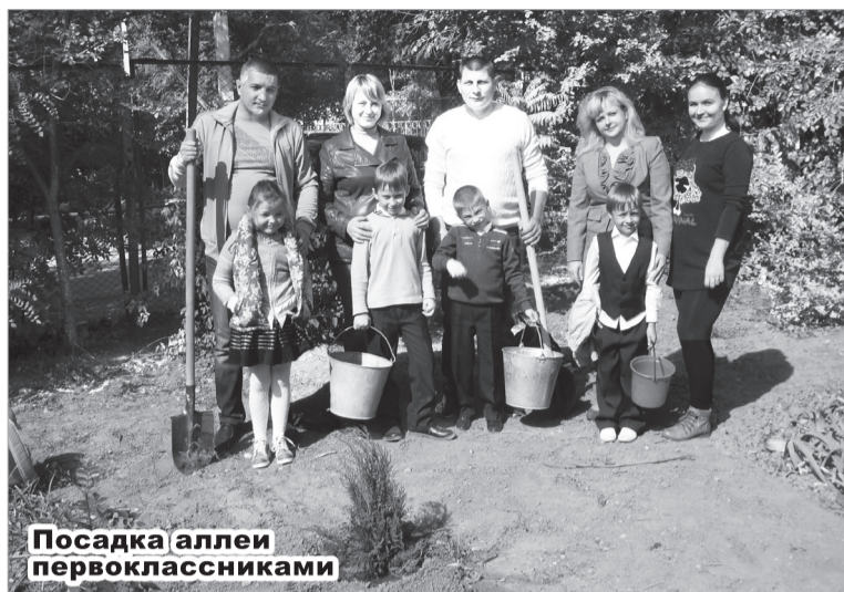
Посадка аллеи первоклассниками

Школа – наш второй дом, наша большая дружная семья. Как и в каждой семье, мы, учителя и ученики МКОУ СОШ № 2, стремимся к тому, чтобы дом этот был светлым, чистым, уютным и красивым, чтобы хранил память о поколениях детей, закончивших её. Стало традицией сажать деревья, кустарники, цветы на территории школы на добрую память.