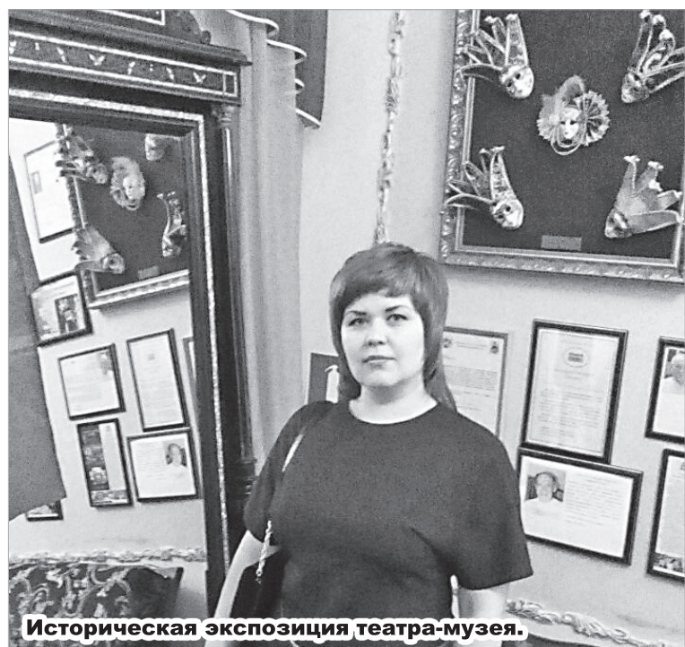
Историческая экспозиция театра-музея.

Уже не первый год по инициативе Первичной профсоюзной организации ООО «РН-Ставропольнефтегаз» для членов профсоюза и их детей совершаются увлекательные поездки выходного дня в различные уголки нашего края и соседних республик.