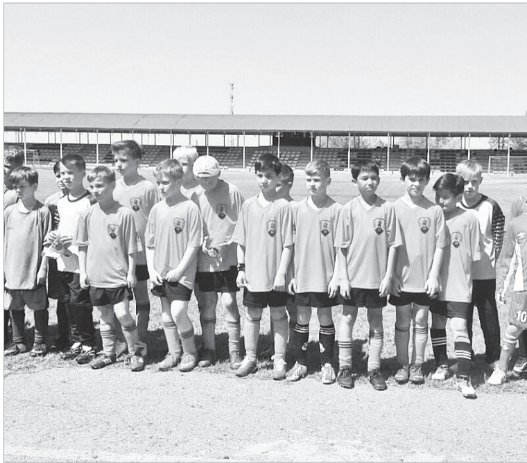
В спортивном комплексе «Старт» г. Нефтекумьска 6 мая состоялся «Открытый детский турнир по футболу среди детей 2005-2006 годов рождения, посвященный Дню Победы».