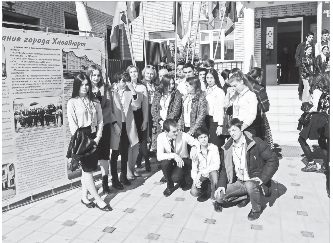
В марте этого года в городе Хасавюрт Республики Дагестан под патронажем Министерства образования и науки РД, Муниципального образования городского округа «города Хасавюрт», проходила Седьмая ежегодная открытая олимпиада по математике, истории России, географии, химии, обществознанию, литературе, физике, биологии, русскому и английскому языкам для учащихся 9-11-х классов общеобразовательных учреждений городов субъектов СКФО «Будущее Кавказа» на основе общеобразовательных программ основного общего образования.